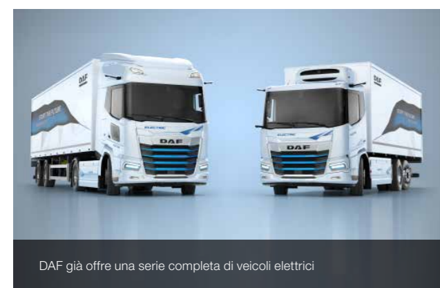
DAF già offre una serie completa di veicoli elettrici

“L'Europa ha imposto al settore dei veicoli industriali una serie di obiettivi onerosi e impegnativi. Tutti i veicoli che usciranno dalle nostre linee di assemblaggio nel 2025 dovranno emettere il 15% di CO 2 in meno rispetto ai veicoli costruiti nel 2019. Secondo le ultime informazioni, questa percentuale salirà al 45% entro il 2030. Ottenere simili risultati solo ottimizzando le tecnologie esistenti è semplicemente impossibile. Dobbiamo esplorare nuove strade se vogliamo mettere in circolazione un numero consistente di veicoli a zero emissioni, da aggiungere ai veicoli con motori diesel efficienti che stiamo producendo già oggi. Poiché sempre più città europee vietano l'accesso nei centri urbani ai veicoli industriali con motori diesel, i nostri clienti sono costretti a passare ai veicoli elettrici o