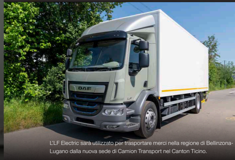
L'LF Electric sarà utilizzato per trasportare merci nella regione di Bellinzona-Lugano dalla nuova sede di Camion Transport nel Canton Ticino.