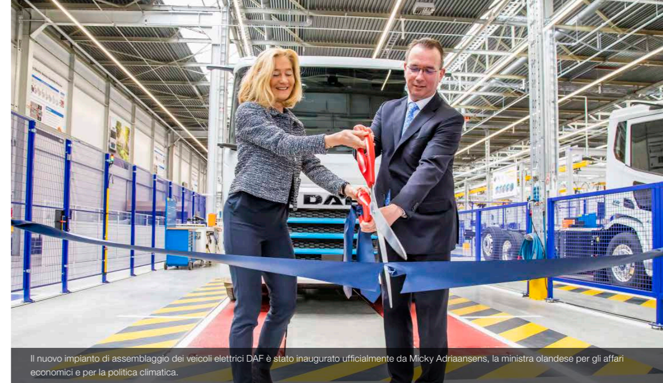
Il nuovo impianto di assemblaggio dei veicoli elettrici DAF è stato inaugurato ufficialmente da Micky Adriaansens, la ministra olandese per gli affari economici e per la politica climatica.

I modelli XD e XF Electric sono disponibili in diverse configurazioni di assali. Sono azionati da motori elettrici PACCAR e dotati di 2-5 gruppi batterie (da 210 a 525 kWh) che assicurano un'autonomia fino a 500 chilometri.