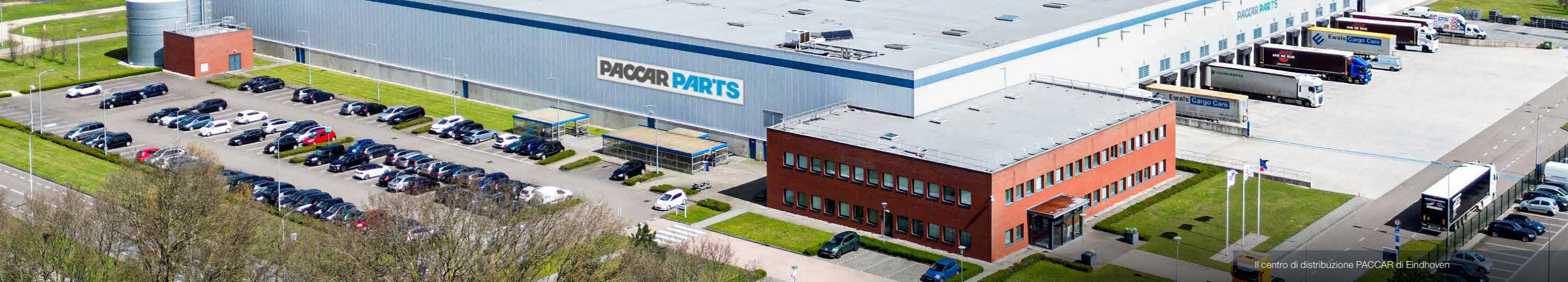
Il centro di distribuzione PACCAR di Eindhoven

PACCAR Parts festeggia 50 anni di attività guardando al futuro