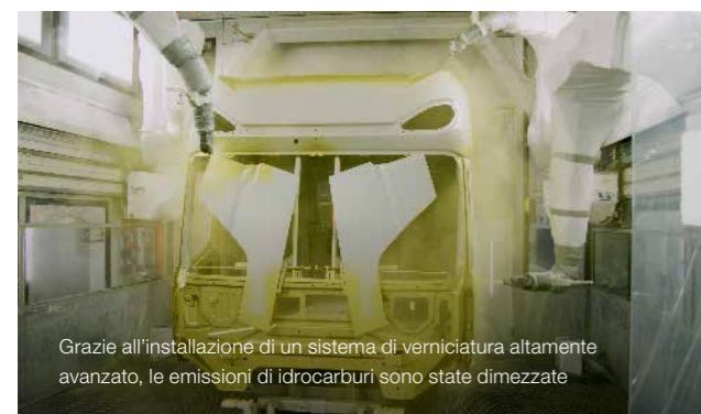
Grazie all'installazione di un sistema di verniciatura altamente avanzato, le emissioni di idrocarburi sono state dimezzate

D AF si impegna a limitare il più possibile l'impatto delle proprie attività sull'ambiente. Ciò richiede un'attenzione costante per ridurre ulteriormente le emissioni e il rumore e per utilizzare l'acqua e l'energia con la massima cura possibile. Un riepilogo completo dell'impegno dell'azienda a favore dell'ambiente richiederebbe troppo spazio, pertanto ci limitiamo a citare alcuni aspetti salienti.