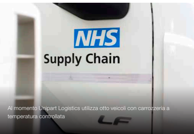
Al momento Unipart Logistics utilizza otto veicoli con carrozzeria a temperatura controllata

L'LF Electric offre il vantaggio di poter utilizzare la ricarica lenta a corrente alternata o la ricarica rapida a corrente continua. Utilizzando un'alimentazione CA trifase da 400 V e 22 kW, il