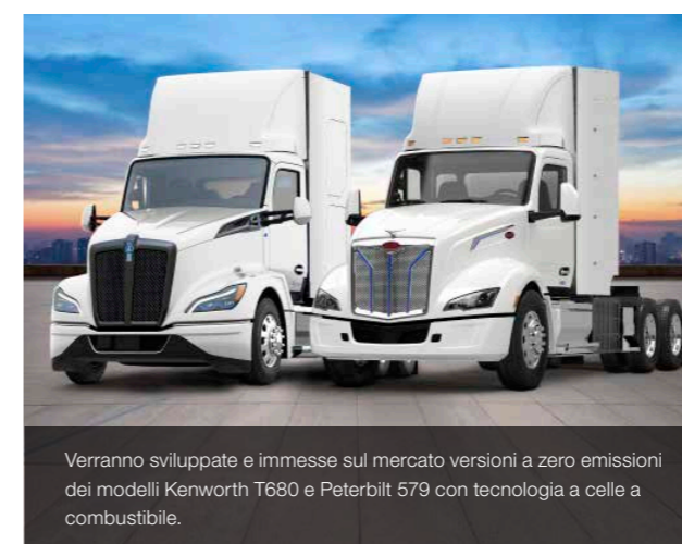
Verranno sviluppate e immesse sul mercato versioni a zero emissioni dei modelli Kenworth T680 e Peterbilt 579 con tecnologia a celle a combustibile.

“Siamo leader nello sviluppo dei veicoli industriali a zero emissioni. Con i modelli XB, XD e XF abbiamo già una serie completa di veicoli elettrici con autonomia fino a 500 chilometri e abbiamo anche effettuato test sul campo molto positivi con i veicoli ibridi. Lo sviluppo di un motore a combustione a idrogeno a zero emissioni si profila molto promettente: PACCAR Inc. ha condotto con successo un test a lungo termine - in collaborazione con Shell e Toyota - su veicoli industriali alimentati da celle a combustibile. Questa sperimentazione ha dato origine a una collaborazione ancora più intensa con l'obiettivo di sviluppare e immettere successivamente sul mercato una versione a zero emissioni dei modelli Kenworth T680 e Peterbilt 579, con tecnologia a celle a combustibile di Toyota. Ovviamente, stiamo seguendo molto da vicino questi sviluppi.”