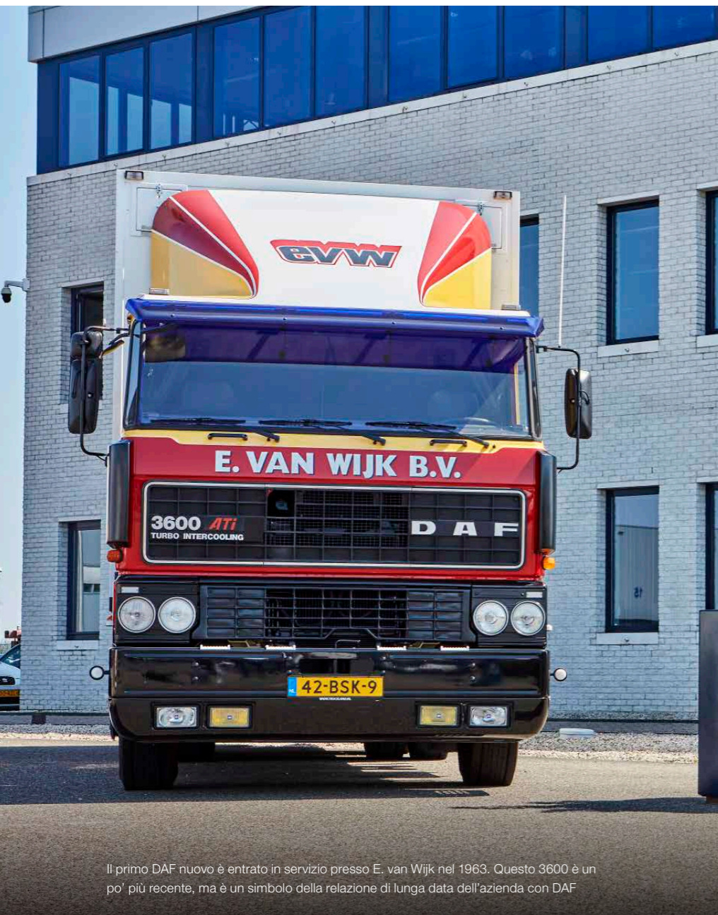
Il primo DAF nuovo è entrato in servizio presso E. van Wijk nel 1963. Questo 3600 è un po' più recente, ma è un simbolo della relazione di lunga data dell'azienda con DAF

altalenante. Ciò significa che tasserà più pesantemente il settore compresi i veicoli diesel, e utilizzerà i fondi per investire nella transizione energetica. Saranno previsti sussidi e un sistema di scambio di diritti di emissione di CO 2 . Con un'attenta pianificazione, sarà possibile ridurre il costo totale di proprietà (TCO) di un veicolo elettrico al di sotto di quello di un veicolo diesel entro un lasso di tempo molto breve”, sostiene Van Wijk. “Al momento, forse è questo il segreto meglio custodito dei Paesi Bassi”.